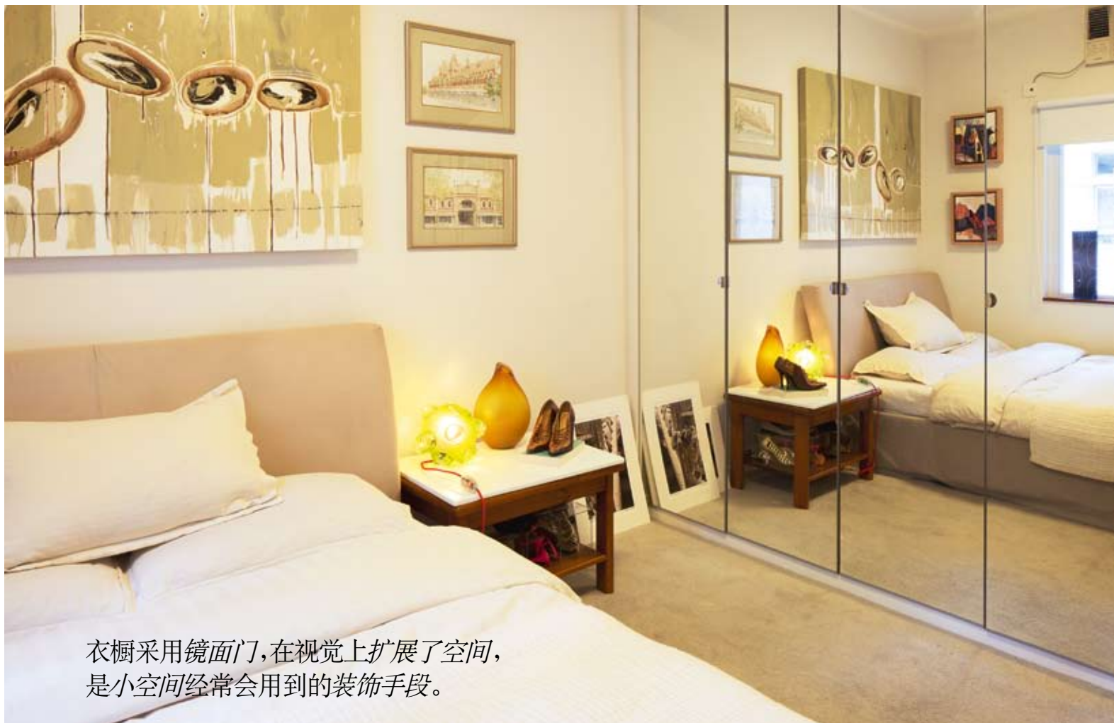
衣橱采用镜面门,在视觉上扩展了空间,是小空间经常会用到的装饰手段。